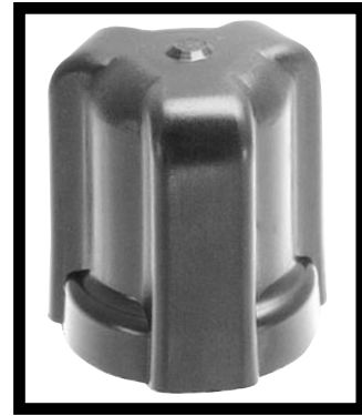
Switch Boot P/N 79380 for Vacuum and Pressure

Type: Direct action blade contact Contacts: Silver alloy, gold plated Set Point: Factory set from 0.5 to 150 PSI Operating Pressure: 150 PSI for 0.5-24 PSI set point range, 250 PSI for 25-150 PSI set point range Proof Pressure: 500 PSI Burst Pressure: 750 PSI for 0.5-24 PSI set point range, 1250 PSI for 25-150 PSI set point range.