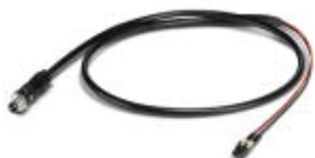
GOF MM cable, assembled with M12 OPTIC to LC duplex

Assembled FO cable, round cable, 50/125 µm GOF-MM fiber, M12 to LC duplex, for installation inside housing