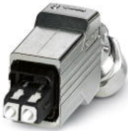
Push-pull connector (version 14), die-cast zinc, with SC-RJ insert for GOF, for cable diameter of 5.5 mm ... 10 mm, cable outlet at the bottom

Please be informed that the data shown in this PDF Document is generated from our Online Catalog. Please find the complete data in the user's documentation. Our General Terms of Use for Downloads are valid ( http://phoenixcontact.com/download )