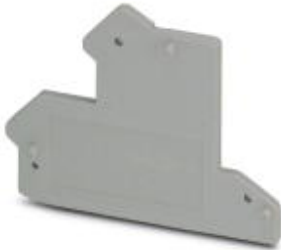
End cover, Length: 56.7 mm, Width: 2.5 mm, Height: 52.3 mm, Number of positions: 1, Color: gray

Please be informed that the data shown in this PDF Document is generated from our Online Catalog. Please find the complete data in the user's documentation. Our General Terms of Use for Downloads are valid ( http://phoenixcontact.com/download )