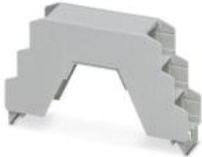
Upper part of housing, for COMBICON connection, three-level

Please be informed that the data shown in this PDF Document is generated from our Online Catalog. Please find the complete data in the user's documentation. Our General Terms of Use for Downloads are valid ( http://download.phoenixcontact.com )