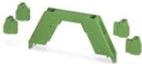
Illustration shows a fully mounted version of the electronic housing

Housing upper part, complete with PCB terminal blocks for full assembly. 8-pos., housing width: 12.5 mm