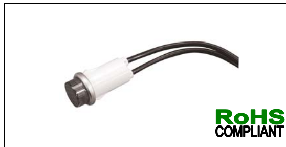
Recommended panel thickness: 0.030" to 0.090"