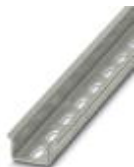
DIN rail, material: steel galvanized and passivated with a thick layer, perforated, height 15 mm, width 35 mm, length: 2000 m

DIN rail perforated - NS 35/15 PERF 2000MM - 1201730