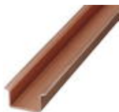
DIN rail, material: Copper, unperforated, 1.5 mm thick, height 15 mm, width 35 mm, length: 2 m

DIN rail - NS 35/15 CU UNPERF 2000MM - 1201895