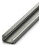
G-profile DIN rail, material: Steel, unperforated, height 15 mm, width 32 mm, length 2 m

DIN rail - NS 32 UNPERF 2000MM - 1201015