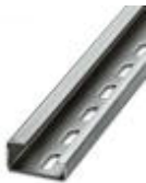
G-profile DIN rail, material: Steel, perforated, height 15 mm, width 32 mm, length 2 m

DIN rail - NS 35/15 CU UNPERF 2000MM - 1201895