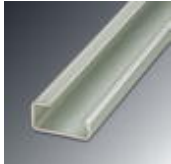
G rail 32 mm (NS 32)

DIN rail - NS 32 AL UNPERF 2000MM - 1201028