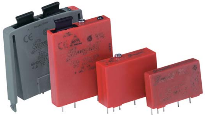
70L-ODC5R 70G-ODCR/OACRLY 70-ODCR/OACRLY 70M-ODCR