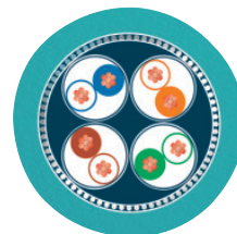
Ethernet 10 Gbit [94F]