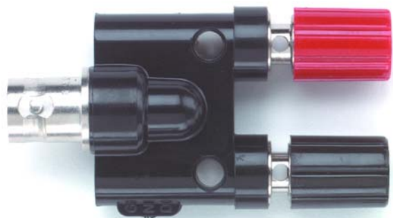
Model 1452 Adapter-Binding Posts to BNC Receptacle