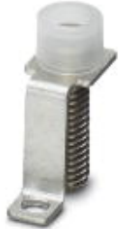
Step bracket, Number of positions: 2, Color: silver

Please be informed that the data shown in this PDF Document is generated from our Online Catalog. Please find the complete data in the user's documentation. Our General Terms of Use for Downloads are valid ( http://phoenixcontact.com/download )