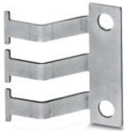
EMC cable catch rail

Please be informed that the data shown in this PDF Document is generated from our Online Catalog. Please find the complete data in the user's documentation. Our General Terms of Use for Downloads are valid ( http://phoenixcontact.com/download )