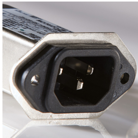
EJT Flanged EMI Filter