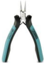
Electronic round-nose pliers, smooth grip, with opening spring

Please be informed that the data shown in this PDF Document is generated from our Online Catalog. Please find the complete data in the user's documentation. Our General Terms of Use for Downloads are valid ( http://download.phoenixcontact.com )