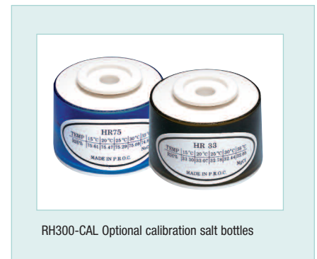
RH300-CAL Optional calibration salt bottles