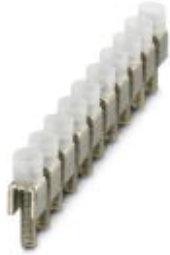
Fixed bridge, Number of positions: 10, Color: silver

Please be informed that the data shown in this PDF Document is generated from our Online Catalog. Please find the complete data in the user's documentation. Our General Terms of Use for Downloads are valid ( http://download.phoenixcontact.com )