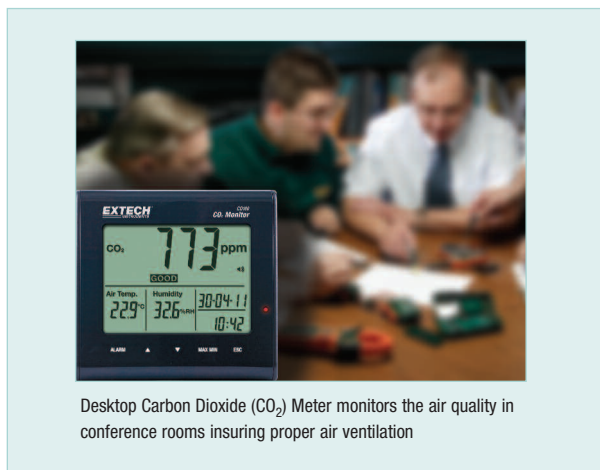
Desktop Carbon Dioxide (CO 2 ) Meter monitors the air quality in conference rooms insuring proper air ventilation