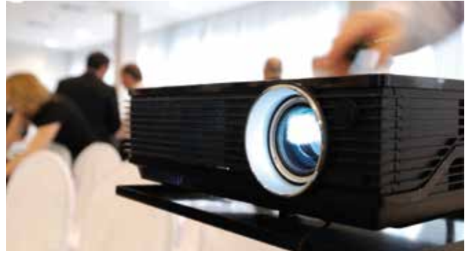
The power of simplicity: 50W blue laser light out of a single package

Unique 50W optical output power: the new laser module PLPM4 450 from OSRAM Opto Semiconductors greatly simplifies the construction of professional laser projectors. For the first time up to 20 blue laser chips have been packaged into a compact housing. In addition, the optical power of the individual chips has been doubled, thus achieving a total power of 50 watts and enabling projectors over 2,000 lumens of brightness with only one housing.