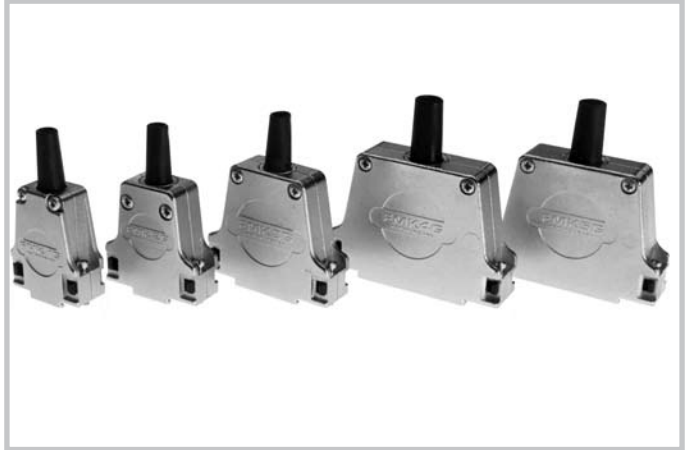
Metal hoods, series FMK...G, in shell sizes 1 - 5. Metallhauben der Serie FMK...G in den Gehäusegrößen 1 - 5.