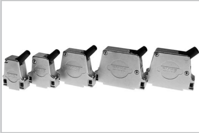
Metal hoods, series FMK, in shell sizes 1 - 5. Metallhauben der Serie FMK in den Gehäusegrößen 1 - 5.