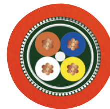
Sercos III [93K]