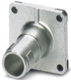
Flange housing, 25 mm x 25 mm

Please be informed that the data shown in this PDF Document is generated from our Online Catalog. Please find the complete data in the user's documentation. Our General Terms of Use for Downloads are valid ( http://download.phoenixcontact.com )