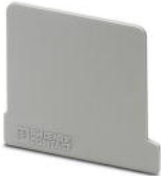
End cover, Length: 42.5 mm, Width: 1.3 mm, Color: gray

Please be informed that the data shown in this PDF Document is generated from our Online Catalog. Please find the complete data in the user's documentation. Our General Terms of Use for Downloads are valid ( http://download.phoenixcontact.com )