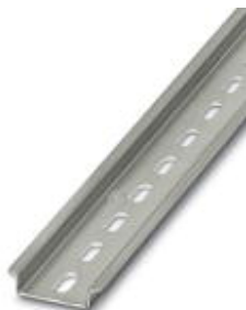
DIN rail, material: Steel, perforated, height: 7.5 mm, width: 35 mm, length: 1 m

Please be informed that the data shown in this PDF Document is generated from our Online Catalog. Please find the complete data in the user's documentation. Our General Terms of Use for Downloads are valid ( http://download.phoenixcontact.com )