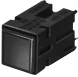
PWB Mount (One-piece plunger)