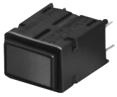
PWB Mount (Standard plunger)