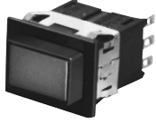
Panel Mount (Standard plunger)