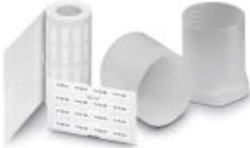
The figure shows the EML (20X8)R product variant

Label, Roll, white, unlabeled, can be labeled with: THERMOMARK ROLL, THERMOMARK ROLL X1, THERMOMARK X, THERMOMARK S1.1, Mounting type: Adhesive, Lettering field: 16 x 7 mm