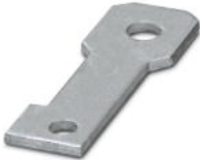
Plate for fixing the FLT-ISG-100-EX isolating spark gap to a flange, drill hole diameter of 14 mm.

Please be informed that the data shown in this PDF Document is generated from our Online Catalog. Please find the complete data in the user's documentation. Our General Terms of Use for Downloads are valid ( http://phoenixcontact.com/download )