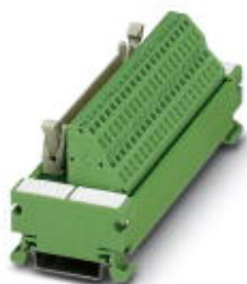
VARIOFACE COMPACT LINE, interface module for 32 channels, with LED, for assembly on DIN rail NS 35/7.5, spring-cage connection

Please be informed that the data shown in this PDF Document is generated from our Online Catalog. Please find the complete data in the user's documentation. Our General Terms of Use for Downloads are valid ( http://phoenixcontact.com/download )