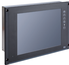
▲ Side view