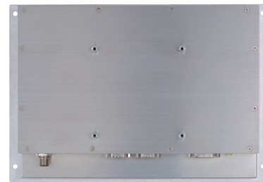
▲ Rear view