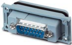
D-SUB panel mounting frame, shell size 2, with 15 signal contacts, pin, gender changer, shielded, IP67 degree of protection

Please be informed that the data shown in this PDF Document is generated from our Online Catalog. Please find the complete data in the user's documentation. Our General Terms of Use for Downloads are valid ( http://phoenixcontact.com/download )