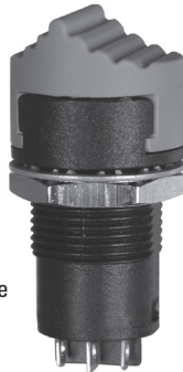
Raised Button Style