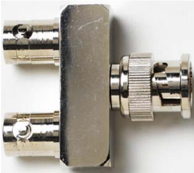
Model 6754 BNC (F/M/F) Adapter, In-Line 75 Ω