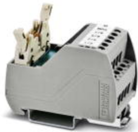
VARIOfACE Professional (VIP) board for the ROC800 controller

Please be informed that the data shown in this PDF Document is generated from our Online Catalog. Please find the complete data in the user's documentation. Our General Terms of Use for Downloads are valid ( http://phoenixcontact.com/download )