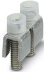
Fixed bridge, Number of positions: 2, Color: silver

Please be informed that the data shown in this PDF Document is generated from our Online Catalog. Please find the complete data in the user's documentation. Our General Terms of Use for Downloads are valid ( http://download.phoenixcontact.com )