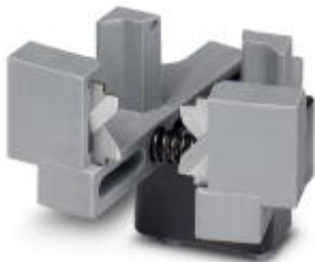
Replacement knife for the automatic stripping and crimping device CF 3000-2,5

Please be informed that the data shown in this PDF Document is generated from our Online Catalog. Please find the complete data in the user's documentation. Our General Terms of Use for Downloads are valid ( http://download.phoenixcontact.com )