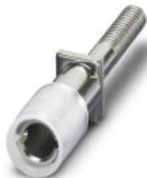
Female test connector, Color: silver

Please be informed that the data shown in this PDF Document is generated from our Online Catalog. Please find the complete data in the user's documentation. Our General Terms of Use for Downloads are valid ( http://download.phoenixcontact.com )