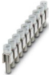
Fixed bridge, Number of positions: 10, Color: silver

Please be informed that the data shown in this PDF Document is generated from our Online Catalog. Please find the complete data in the user's documentation. Our General Terms of Use for Downloads are valid ( http://download.phoenixcontact.com )