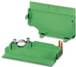
Cable housing, Pitch: 0 mm, Number of positions: 19, Dimension a: 95 mm, Color: green

Please be informed that the data shown in this PDF Document is generated from our Online Catalog. Please find the complete data in the user's documentation. Our General Terms of Use for Downloads are valid ( http://phoenixcontact.com/download )