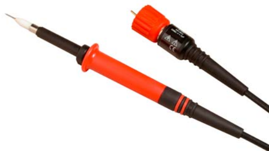
Model 6498 1000V CAT II Passive Oscilloscope Probe