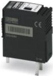
Replacement plug for PLUGTRAB PT-IQ controller for power supply

Please be informed that the data shown in this PDF Document is generated from our Online Catalog. Please find the complete data in the user's documentation. Our General Terms of Use for Downloads are valid ( http://phoenixcontact.com/download )