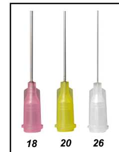
Needle Gauge (GA)