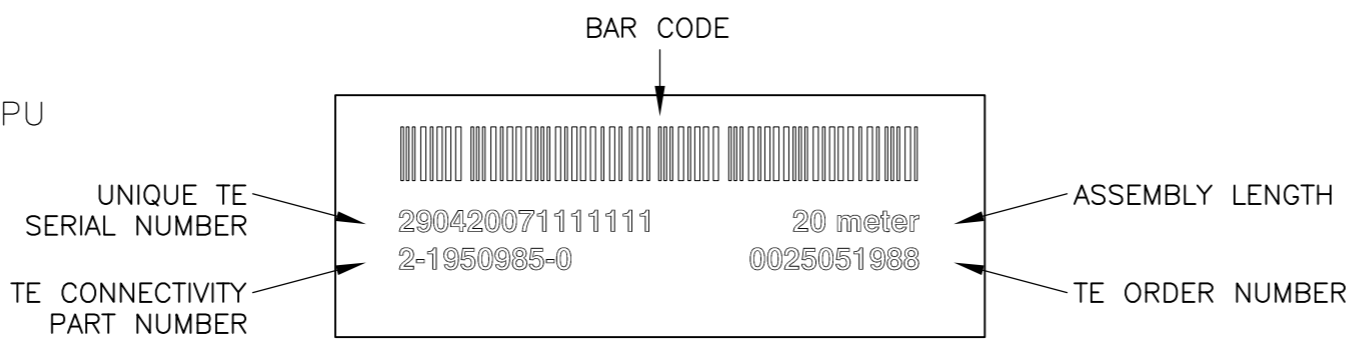
LABEL DETAIL: 3