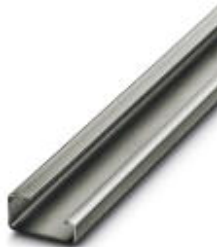
G-profile DIN rail, material: Steel, unperforated, height 15 mm, width 32 mm, length 2 m

Please be informed that the data shown in this PDF Document is generated from our Online Catalog. Please find the complete data in the user's documentation. Our General Terms of Use for Downloads are valid ( http://download.phoenixcontact.com )