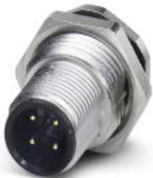
Flush-type connector, 4-position, Flush-type plug, straightLink:M12, A-coded, Solder pins

Please be informed that the data shown in this PDF Document is generated from our Online Catalog. Please find the complete data in the user's documentation. Our General Terms of Use for Downloads are valid ( http://download.phoenixcontact.com )