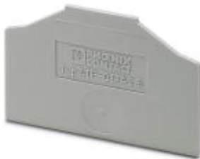
Partition plate, Length: 55 mm, Width: 1.5 mm, Height: 51 mm, Color: gray

Please be informed that the data shown in this PDF Document is generated from our Online Catalog. Please find the complete data in the user's documentation. Our General Terms of Use for Downloads are valid ( http://download.phoenixcontact.com )