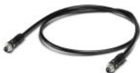
GOF MM cable, assembled with M12 OPTIC to M12 OPTIC

Assembled FO cable, round cable, 50/125 µm GOF-MM fiber, M12 to M12, for installation inside buildings