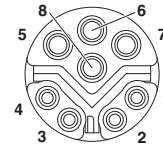
Pin assignment M12 socket, 8-pos.