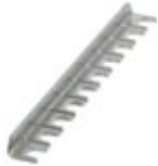
Fixed bridge, Number of positions: 10, Color: silver

Please be informed that the data shown in this PDF Document is generated from our Online Catalog. Please find the complete data in the user's documentation. Our General Terms of Use for Downloads are valid ( http://download.phoenixcontact.com )