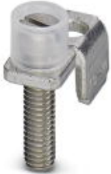
Chain bridge, Number of positions: 1, Color: silver

Please be informed that the data shown in this PDF Document is generated from our Online Catalog. Please find the complete data in the user's documentation. Our General Terms of Use for Downloads are valid ( http://phoenixcontact.com/download )