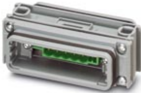
D-SUB coupling, for DeviceNet, shell size 3, header, unshielded, connection direction straight, IP67 degree of protection

Please be informed that the data shown in this PDF Document is generated from our Online Catalog. Please find the complete data in the user's documentation. Our General Terms of Use for Downloads are valid ( http://download.phoenixcontact.com )